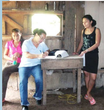
Promotora de Salud realizando encuesta en Rancho Grande.

Los Promotores y Equipo Técnico de APLV estuvieron visitando 10 comunidades de los municipios Waslala, Rancho Grande, Nueva Guinea, San Dionisio, Teustepe y Jícara para realizar el diagnóstico higiénico sanitario y los estudios topográficos para la formulación de proyectos de agua potable y saneamiento.