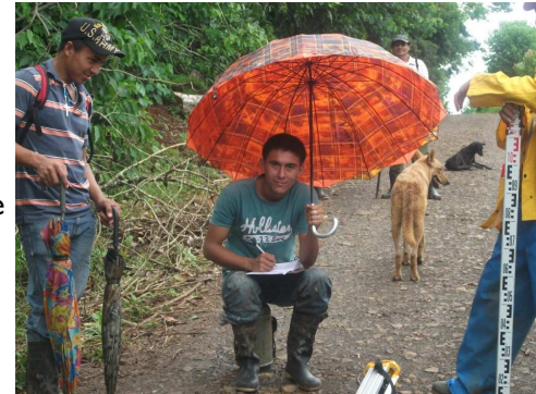
Comunitarios y Técnicos de APLV realizando topografía en Nueva Guinea.

Los comunitarios se mostraron felices y entusiasmados con la esperanza de que pronto puedan tener el líquido vital en sus propios hogares sin tener que arriesgarse a buscarla en lugares lejanos e inaccesibles.