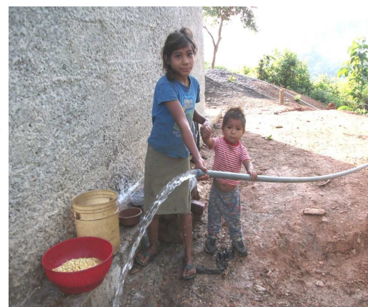
Esta niña del Varillal ya no debe viajar 500 metros para lavar el maíz para las tortillas. Su puesto de agua esta en construcción.

Los comunitarios de la Chocolate y El Varillal agradecen a sus donantes, Alcaldías Municipales y Agua Para La Vida por todo el apoyo brindado durante la fase de ejecución de su proyecto.