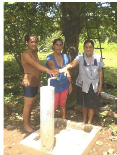
Abuela, Hija y Nieta contentas por su puesto de agua.

¡Felicidades a los beneficiarios, por hacer su sueño realidad!. Seguro ninguna navidad será como esta en Walana.